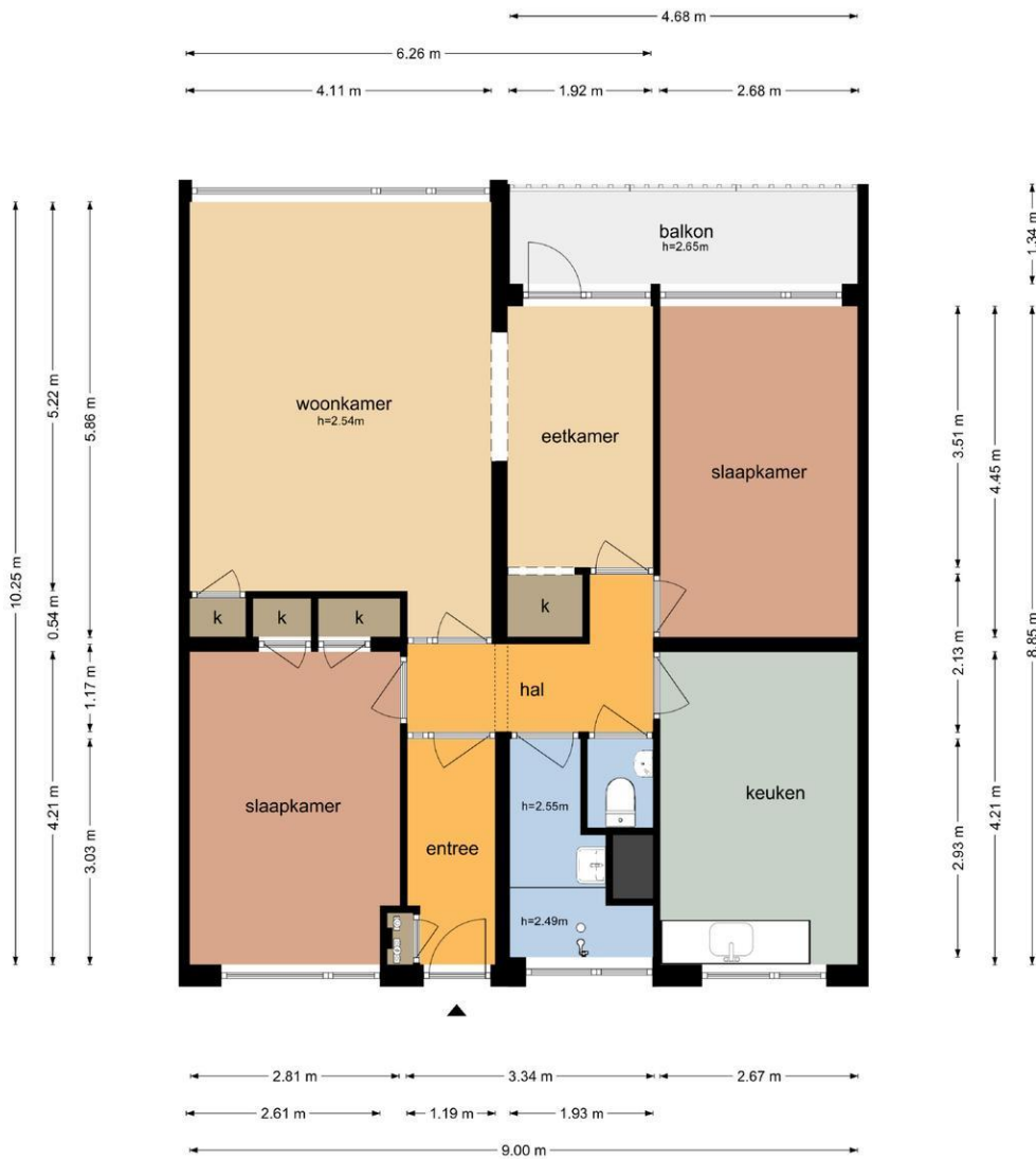
Grote Markt 87 - Dordrecht Tweede Verdieping

De plattegronden zijn geproduceerd voor promotionele doeleinden en ter indicatie. Aan de plattegronden kunnen geen rechten worden ontleend © www.objectenca.nl