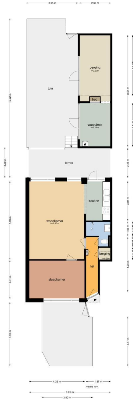
Weissenbruchstraat 89 - Dordrecht Begane Grond

De plattegronden zijn geproduceerd voor promotionele doeleinden en ter indicatie. Aan de plattegronden kunnen geen rechten worden ontleend.